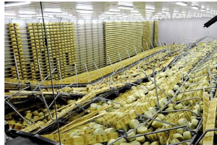
Le scalere, scaffali per la stagionatura delle forme di parmigiano, crollate nel terremoto del maggio 2012

L'intervento antisismico aumenta il valore del fabbricato ed evita importanti rischi penali a carico del datore di lavoro