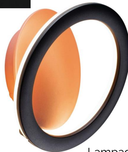
Lampada Giotto, contraffazione