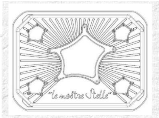
Vaschette della convenuta