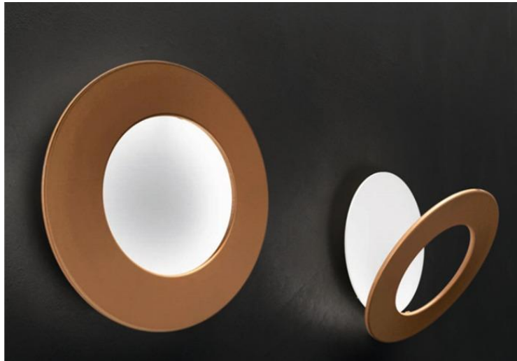
Modello Vera, anteriore