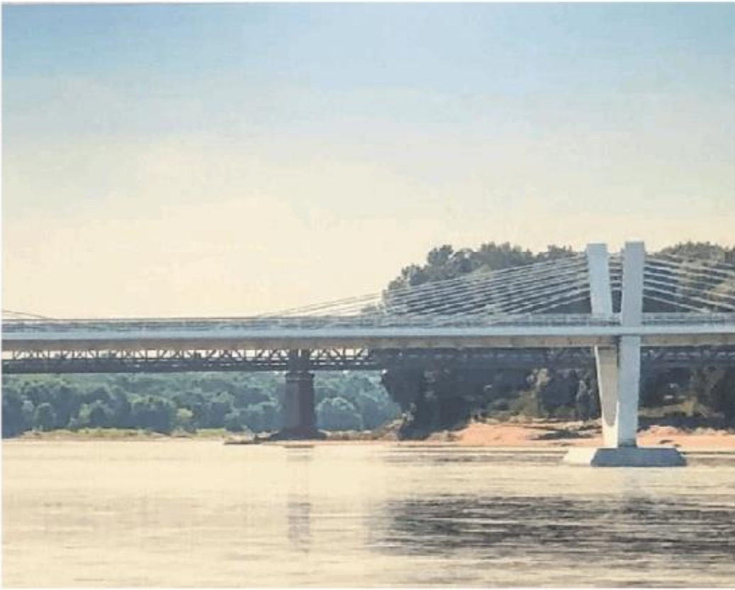
Il modello scelto per il nuovo ponte: ora si apre la fase della progettazione. Nella foto a destra Vittorio Poma