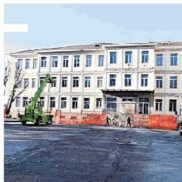
La sede Ato di via Taramelli

La bolletta non aumenta, vediamo come è composta: la tariffa base è di 0,73 euro al metro cubo. Quella agevolata di 0,58 e riguarda il consumo dei primi 50 litri per abitante al giorno. La prima fascia di eccedenza è di 0,89 euro e scatta per chi consuma tra i 41 e i 70 metri cubi (109,59 litri/abitante al giorno). La terza fascia è di 0,99 e si calcola dopo il superamento di 71 metri cubi (191,78 litri per abitante al giorno). Bisogna poi aggiungere la quota fissa (8,11 euro all'anno).