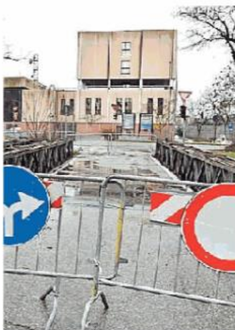
Il ponte chiuso dal 2019

Pavia È stato pubblicato sulla Gazzetta ufficiale della Repubblica italiana il bando di gara per la realizzazione del nuovo ponte Ghisoni. È stata aggiunta anche la rettifica sui termini per la presentazione delle offerte. Inizialmente era stato fissato al 18 gennaio, in seguito è stato prorogato al 31 gennaio. Il valore dell'opera è di 1,3 milioni di euro. L'attuale ponticello Bailey è ormai chiuso dal 9 dicembre 2019, da quando, cioè, vi fu il primo allarme sulla sua staticità. Un problema al quale sta andando incontro anche il secondo ponte Bailey, quello che immette in viale Lodovico il Moro.