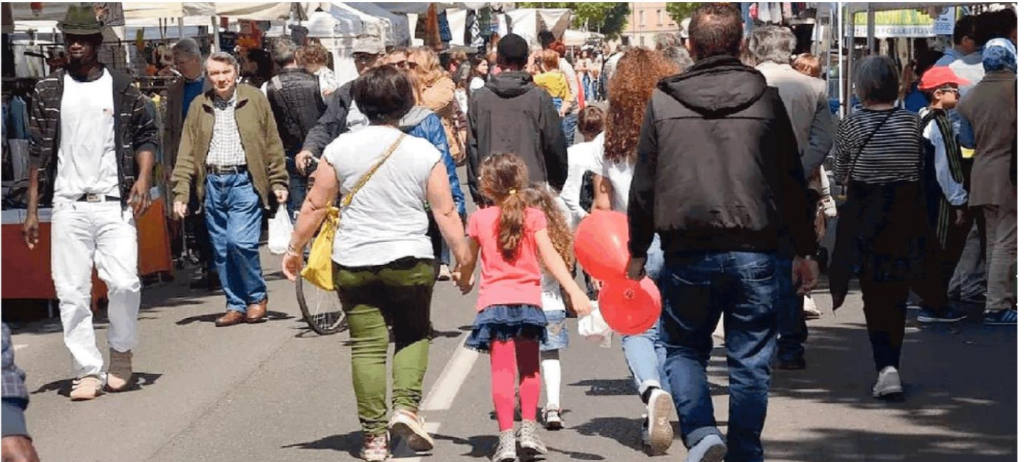
Un'immagine della Fiera dell'Ascensione che richiama a Voghera migliaia di persone da tutta la provincia di Pavia. Nel 2020 era stata annullata a causa del Coronavirus