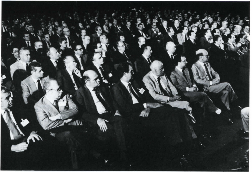
Due aspetti del Salone dell'Assemblea durante i lavori. Nelle prime file le principali autorità civili e militari milanesi e i maggiori esponenti del mondo industriale.