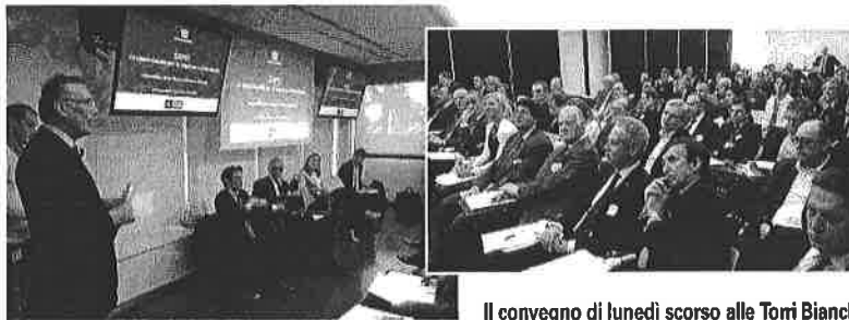
Il convegno di lunedì scorso alle Torri Bianche