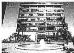
La sede Cisco a Vimercate