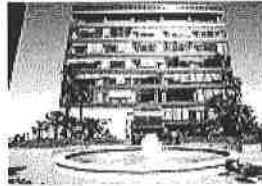
La sede Cisco a Vimercate

Fare rete tra le imprese brianzole per Expo 2015. "E' una grande occasione- ha affermato Fabio Benasso, consigliere per Expo, di Assolombarda - per rilanciare il made in Italy". Questo il messaggio di lunedì alla Cisco a Vimercate all'incontro "Expo le opportunità per le imprese e il territorio".