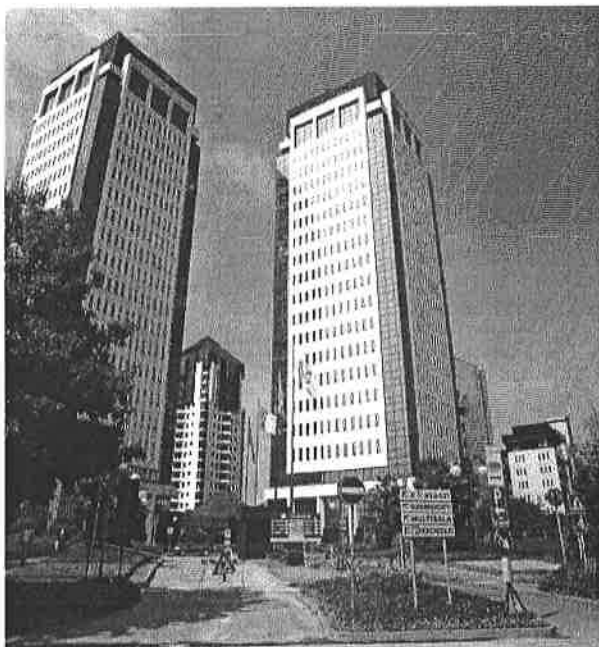
Le Torri Bianche di Vimercate