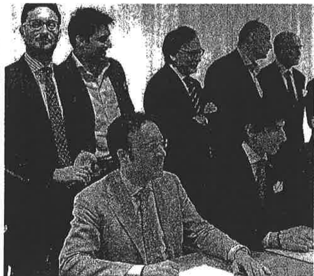
Convegno Lanciata la sfida per una nuova leva imprenditoriale