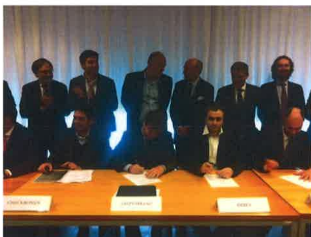
Un momento della presentazione di Startup Town

Le startup possono aderire gratuitamente ad Assolombarda . Questo è il segnale simbolico, e non solo, lanciato da Startup Town, iniziativa che nasce come ponte tra gli innovatori e le piccole e medie imprese lombarde. “Se vola questa città, vola l'Italia. Questa è la città che ha più ragioni per farcela” , è la sintesi di Gianfelice Rocca, il presidente di Assolombarda. Il numero da cambiare è questo: l'Italia ha il 6% delle citazioni scientifiche nel mondo, ma soltanto l'1% dei brevetti. Questo significa che la nostra ricerca scientifica è di qualità, nonostante i pochi fondi, ma ancora troppo lontana dalle aziende. Il modello a cui ispirarsi è quello tedesco, dove i numeri decisivi sono molto più vicini: 11% di ricerca e 8% di brevetti, con ricerca e innovazione che viaggiano insieme. “Startup Town è un mattone nello sforzo per cambiare questo numero”.